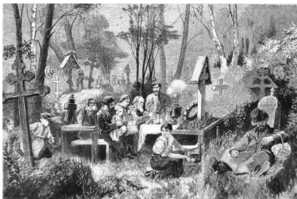
Семицкие помины на кладбище. Гравюра. Кон. XIX в.

просуществовали до второй половины XX столетия. Так, сибирские старообрядцы ещё не так давно продолжали по старинке праздновать Семик «в девяту пятницу» после Пасхи 2 и не признавали новый календарный счёт, в соответствии с которым Семик отмечали через пять девятин после Пасхи в четверг перед днём Троицы. Спустя тысячелетие народная традиция продолжала сближать праздник весенних посевов с празднеством новолетия, отмечавшимся на Масленицу. В «Словаре» Владимира Даля приводятся поговорки: «Звал-позывал честной Семик широкую Масленицу к себе погулять», «Масленица – семикова племянница».