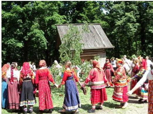
Семицкий девичий хоровод. XX в.

Все члены общины «кумились» друг с другом – целовались через венки, клялись в верности, роднились друг с другом и с незримыми предками. Весь род представлял единым и словно воплощался в священном дереве – от корней и ствола до веток с молодыми порослями. Отламывая их, сплетая в венки или пучки и разнося по домам, чтили единство семьи и рода – связь с живыми и умершими. Затем возвращались в село и созывали всех на мирской пир, приглашая на него кумов (души предков), а также сирот, вдовых и больных.