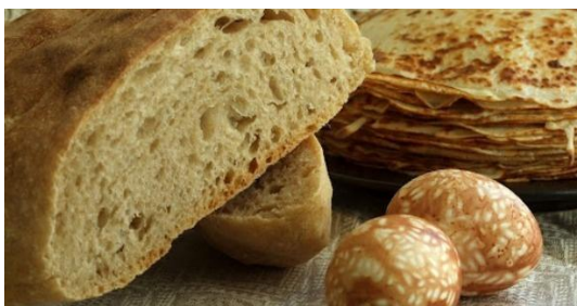
Поминальная радоничная трапеза

На обсохших пригорках «правили новiны » – расстилали новые холсты с хлебом-солью и подобно дорогой гостье встречали весну. В южнорусских землях встречать весну начинали на сорок дней раньше, с Масляны . После радоничной тризны всем селом шли в рощи. В честь предков «заламывали» молодые берёзки – сгибали и соединяли в виде зелёных сводов их вершины для встречи небесных «гостей» – кумов . Вероятно, в древности, и мужчины и женщины сплетали из берёзовых веточек венки и увенчивали себя священными зелёными хорнами или хорóнами , хронами (от праславянского * хорна «охрана, ограда», родственного латинскому corona «венец, веноч, круговые укрепления»).