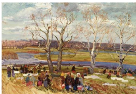
Шурпин Ф.С. Этуд к картине "Радоница" Вт. пол. XX в. Картон, масло.

По народному календарю, от Радоницы вели начало тёплых дождей и плодоносных рос, появление листьев почитаемой берёзы, прилёт из ирия кукушки, пробуждение пчёл в дуплах и медведя в берлоге, ужей и лягушек в земле. Природа будто готовила к этому празднику свою великую «радоницу». В этот день древние русы красили яйца в цвет огня и крови, совершали очистительные купания во вскрывшихся реках, а на юге – в первых росах, молились предкам на родных могилах, а молодые начинали водить весенние предбрачные хороводы. День Радоницы отмечался неизменно 1-го мая, на сороковой день после весеннего равноденствия , в середине I тысячелетия н.э. приходившегося на 22-21 марта. Она открывала многодневное празднество Семика – семицкую девятину , которая включала в себя обряды весенней страды и праздник первых всходов. Так начинался восточнославянский земледельческий год.