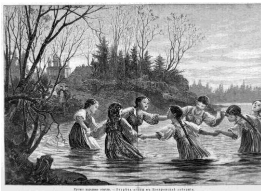
Встреча весны на Радоницу. Гравюра. XIX в.

Противостоять силам зла был призван ежегодно возобновляемый, священный договор ряд и радоничный обряд, в котором выражались отношения человека с небом и землёй, с божеством, с небесным прародителем, воплотившимся в священного медведя, и с душами предков. С наступлением Радоницы ( Радуницы , Радовницы , Рады ) на землю возвращалась пора радбиная , радушная , радостная . Этот праздник неизменно предваряла девятина молитвенных призывов душ предков – Оклички родителей . Эти дни сугубого поста и очищения перед Радоницей представляли собою древнюю «страстную» и назывались говiны или говейно . В православном народном календаре начало Окличек приурочивалось к 20-му апреля, дню памяти св. Фёдора Власяничника, византийского аскета, всю жизнь носившего на теле власяницу.