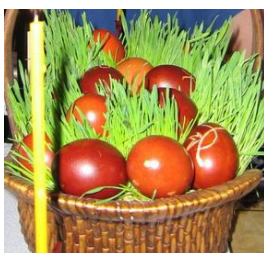
Пасхальные яйца среди проросших злаков.

В русском православии глубоко укоренилась связь воскресения Христова с древнейшими земледельческими обрядами и потому Семик сохранил свой изначальный земледельческий смысл. После Радоницы в течение сорокадневного солнечного кресня длились обряды пробуждения земли, благословения посевов и их оберегов. Начинался сев ржи и проса, открывая пору совместных сельских работ – толók и пóмочей . На семицкой неделе сеяли овёс, горох и лён. На день св. Иова Росенника, 5 мая, в народном календаре отмечали появление первых рос – рóсенники , на св. Ивана 25 мая – обильные, «медвяные росы» и прилёт соловьёв, на св. Никиту Гусятника, 29 мая («через тридевять дней» после Радоницы ) – возвращение из ирия священных гусей и распускание дуба, а на св. Феодосью Колосницу, 29 мая, начало колошения ржи. К этому времени посевная страда почти повсеместно завершалась, в начале июня на северо-востоке Руси сеяли лишь гречку.