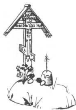
Пасхальный кулич на могиле в Радоницу. Рисунок XIX в.

молитвенных радениях, полевой страде и общем радовании. Девять дней души предков находились обратном пути на небо. Считалось, что они покидали землю после завершения русальских обрядов 4 июля и достигали ирия 13 июля – ровно через 81 день (девять девятин или два солнечных срока) после начала Окличек 22 апреля.