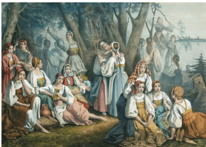
Обряд кумления на Семик. Картина XIX в.

В течение Семика , завершавшегося прощальным кличальным днём, (впоследствии так называли уже от слова кличать «плакать» последний, субботний день троицко-семицкой недели) в украшенные берёзами-оберегами дома приглашали соседей, плели им венки, угощали караваями и иной «семицкой» снедью. В день завершения праздника сельская хороводница собирала женщин и девиц и отдельно от мужчин с песнями вела их в берёзовую рощу. Там они вновь «заламывали» и «завивали берёзки», заключая с этими деревьями-оберегами завет помощи и ограды в семейной жизни. Подружки «кумилась» – целовались через берёзовые венки, обменивались обережными бусами и перстнями, клялись в дружбе, после чего считались родственницами. Затем на поляне расстилали скатерть, на которую клался каравай и цветочные венки. Вокруг с молитвами и славильными песнями вели хороводы, а в завершении «молили каравай», разламывая его на куски и прося себе счастливого брака или замужества. Женский и девичий семицкий пир состоял из неперменной яичницы-глазуньи и лепёшек, испечённых в виде венка с яичным желтком посередине – знаком брака и плодородия. Позже лентами с семицких берёзок и венков девушки перевязывали венчальные свечи и сохраняли до самой смерти. В каждом доме хранились куски от семицкого каравая. Их замешивали в свадебный каравай при замужестве.